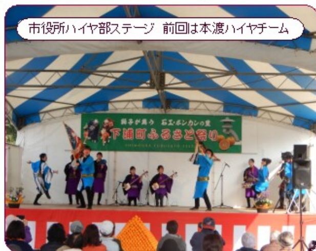
市役所ハイヤ部ステージ 前回は本渡ハイヤチーム