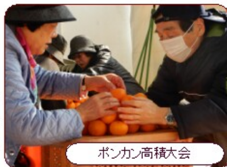
ポンカン高積大会

また、当日は8:30~15:30までの間、コミュニティセンター~国道沿の臨時駐車場~会場をシャトルバスが往復します。どうぞ、お誘い合わせの上、ご家族揃ってご来場ください。お待ちしております!! 詳しくは、チラシをご覧ください。