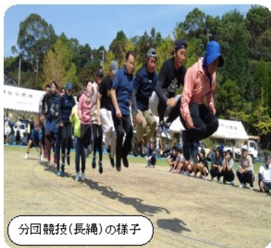
分団競技(長縄)の様子

ご多忙中ご臨席いただきましたご来賓の皆様、大会の運営・準備にご協力いただきました大会役員等の皆様、大変お世話になりました。また、今回の大会に伴い、大会賞品に車海老を提供して頂きました、村崎水産（栖本・下浦）様ありがとうございました。最後に、競技に参加・応援をして下さった皆様、お疲れ様でした。