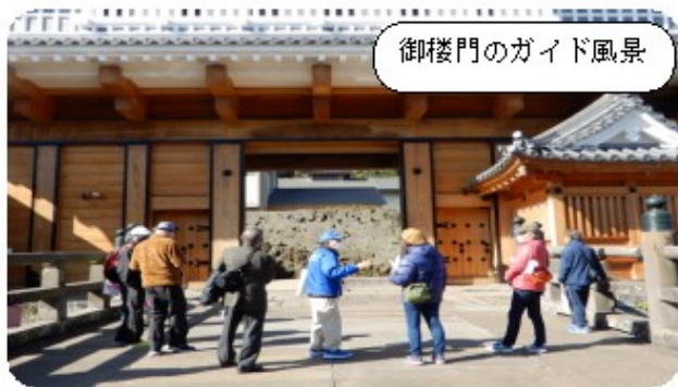
御楼門のガイド風景

下浦町も2月20日(日)に下浦さるくを行う予定です！(※詳細は来月号)今回の研修が少しでも町内ガイドの育成に役立てばと思います。