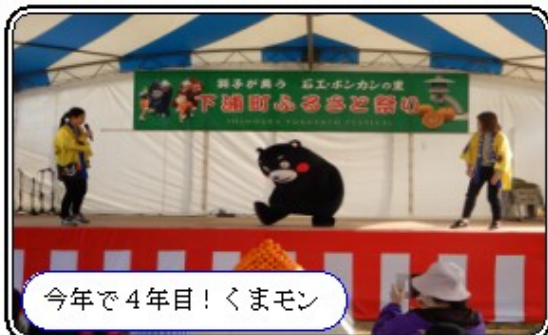
今年で4年目！くまモン