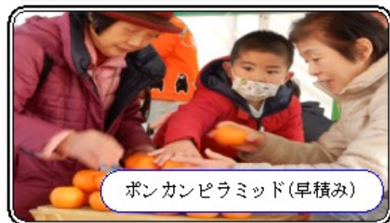
ボンカンピラミッド(早積み)