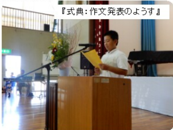
『式典：作文発表のようす』

なお、6分団の地区の皆さんには、今年も本渡ケアホームより送迎バスを運行していただきます。多くの皆さんのご参加をお待ちしています。