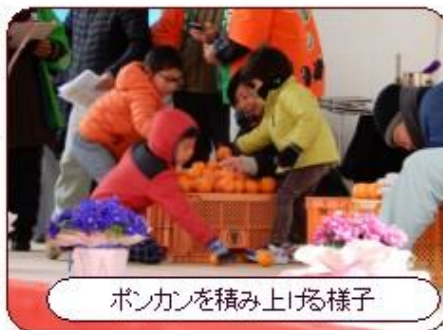
ボンカンを積み上げる様子

また、当日は8:30～15:30までの間、コミュニティー～国道沿の臨時駐車場～会場をシャトルバスが往復します。どうぞ、お誘い合わせの上、ご家族揃ってご来場ください。お待ちしております!!詳しくは、チラシをご覧ください。