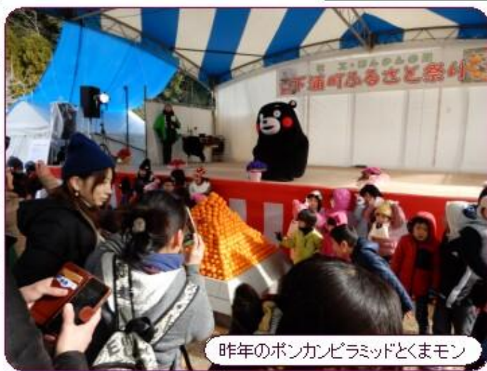
昨年のボンカンピラミッドとくまモン