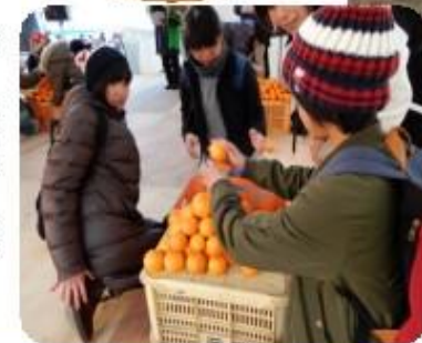
昨年のような 右上:石玉ボウリング 左上:出店テントの様子 左:ボンカンの早積み