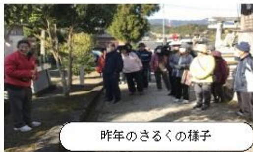
昨年のさるくの様子