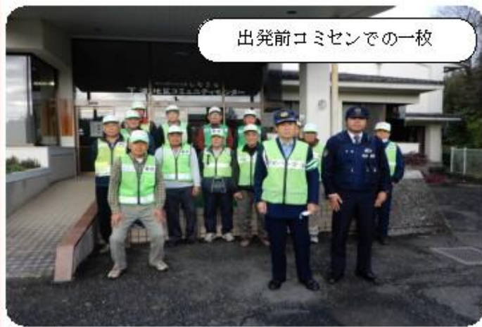
出発前コミセンでの一枚

参加していただいた17名で、4台の青パトに分乗し、本渡東駐在所のパトカーと共に、午後3時過ぎにコミュニティセンターを出発。約1時間30分をかけて町内を一周し、皆さまへ防犯の呼びかけを行いました。忙しくなる年末年始、怪我や事故をしないよう注意しましょう！